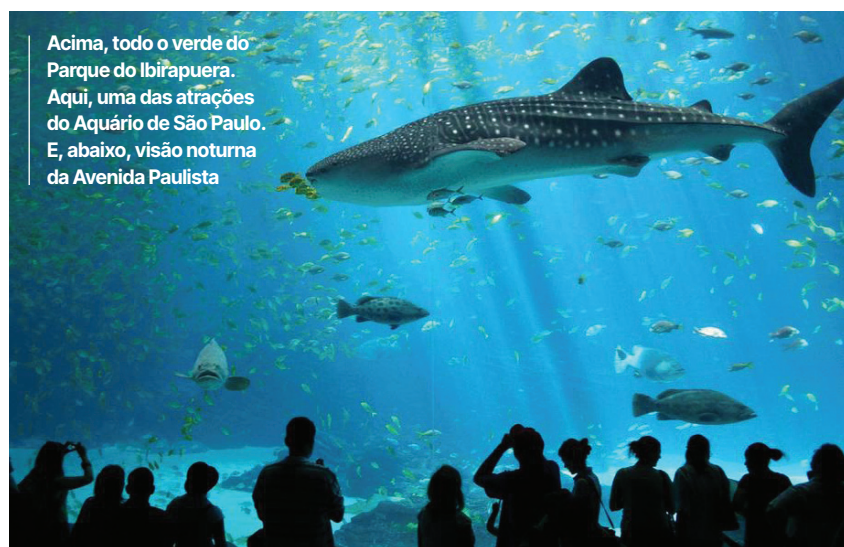
Acima, todo o verde do Parque do Ibirapuera. Aqui, uma das atrações do Aquário de São Paulo. E, abaixo, visão noturna da Avenida Paulista

Por fim, São Paulo é ideal para compras e experiências urbanas únicas. A Avenida Paulista, os shoppings de alto padrão, a Rua Oscar Freire e os centros de compras populares agradam a todos os perfis. Somado a isso, a diversidade cultural da cidade – com influências do mundo inteiro – transforma cada passeio em uma experiência rica, cosmopolita e inesquecível durante as férias. ✳